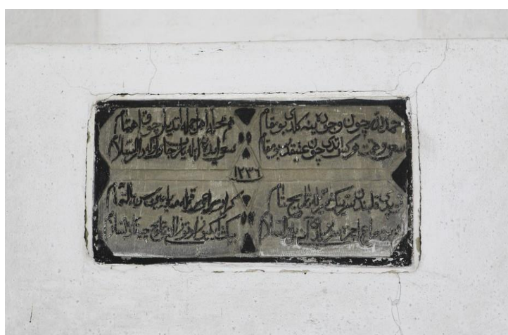
Slika 3.5. Kronogram na Atik džamiji