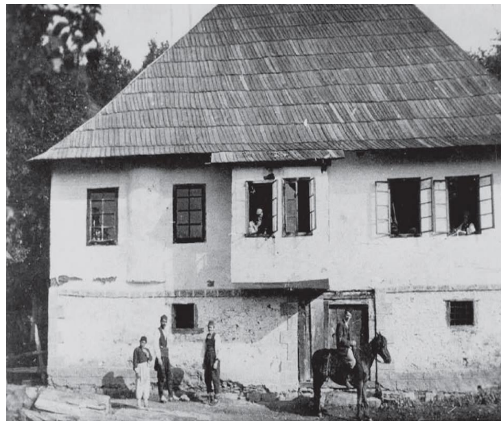
2.1. Tekija u Fojnici