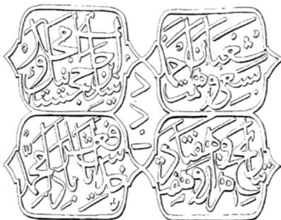
Slika 3.3. Kronogram na Šaban Ahmedovoj (Čaršijskoj) džamiji