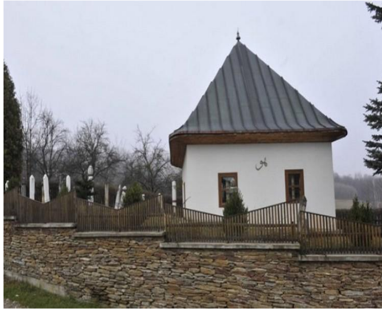
2.4. Turbe šejh Abdurrahmana Sirrije