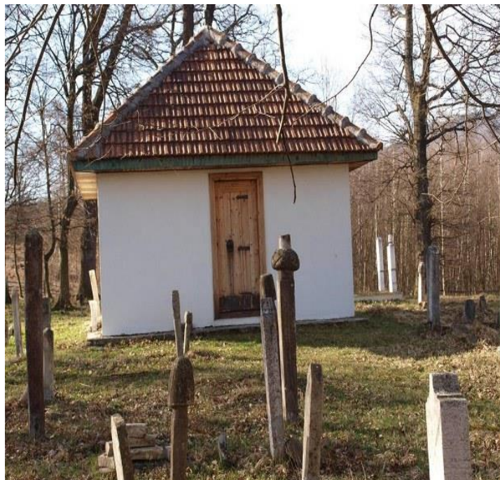
2.5. Turbe Huseina el-Horosanija, šehida sultan Fatihove vojske, 700 metara od Oglavačke tekije.