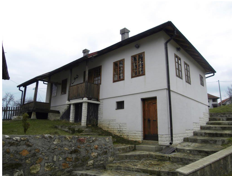
2.3. Tekija na Oglavku