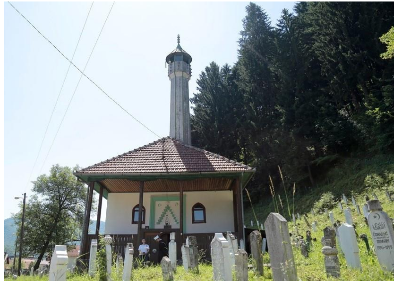
1.1. Atik (stara) džamija