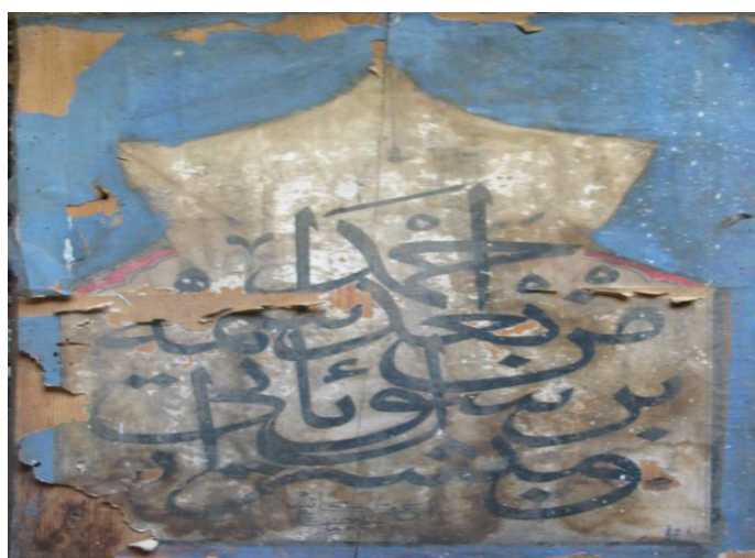
Slika 3.2. Abdurahman Sirri-baba (?), Kur'an (61:6) "Mubašširan bi rasūl ya'tī min ba'dī ismuhu 'Aḥmad" – "I da vam donesem radosnu vijest o Poslaniku čije je ime Ahmed, koji će poslije mene doći", dežli sulus - stil, istif kompozicija, (oko 1260 h./ 1844.), (snimku ustupila Komisija za očuvanje nacionalnih spomenika Bosne i Hercegovine). (Isto, 290.)