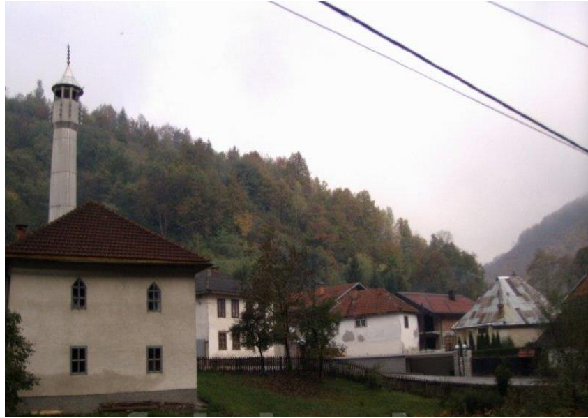
1.3. Džamija hadži Muharem ef. ili Pavlovačka džamija u Fojnici.