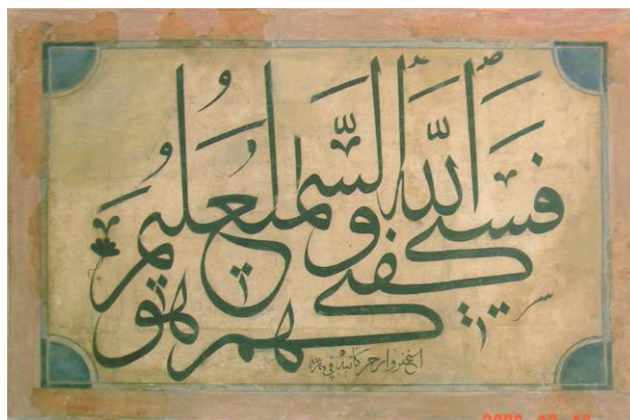
Slika 3.1. Abdurahman Sirri-baba (?), Kur'an (2:137) "Fa sayakfikahum Allāh wa huwa al-samī' al-'alīm" – "Allah će te sigurno od njih zaštititi", jer On sve čuje i sve zna, dežli sulus - stil, istif kompozicija, (oko 1260 h./ 1844.), (snimku ustupila Komisija za očuvanje nacionalnih spomenika Bosne i Hercegovine) (Teparić 2016, 290.)