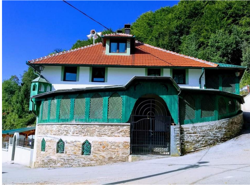
2.2. Tekija u Vukeljićima