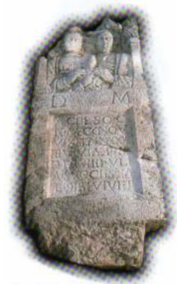
Slika 3 Natpis Ulpije Successe Preuzeto iz Čeman, 2000, 131