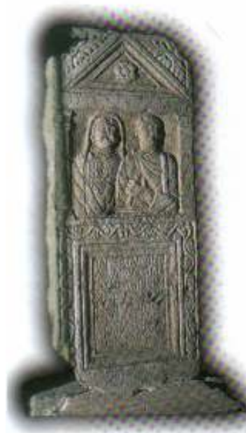
Slika 2 CIL III 13863 Pazarić kod Sarajeva