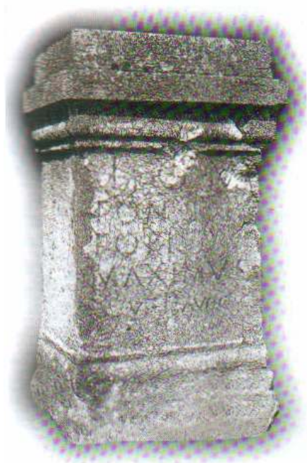
Slika 1 CIL III 2766 a (isp. P. 1035)=8374 Švrakino selo Preuzeto iz Čeman, 2000, 131